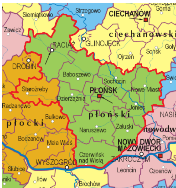
Rys 1. Obszar LGD-PM na tle mapy administracyjnej.

Obszar LGD nie obejmuje gminy miejskiej Płock, która ze względu na przekroczenie 20 tys. mieszkańców, nie mogła zostać objęta Lokalną Strategią Rozwoju (zwaną dalej LSR). Wszystkie miejscowości obszaru LGD-PM mają mniej niż 5 tys. mieszkańców.